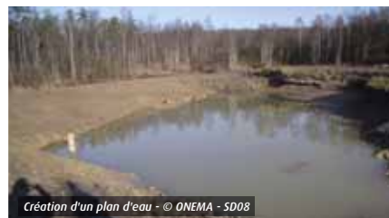
Création d'un plan d'eau

L'item s'applique pour une superficie cumulée du ou des plans d'eau supérieure à 500 m 2 et inférieure à 1 000 m 2 (seuil de déclaration « loi sur l'eau »).