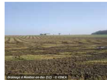
Drainage à Montier-en-Der (52)

Pour un drainage d'une superficie supérieure à 1 ha et inférieure à 20 ha (seuil de déclaration « loi sur l'eau ») pour la partie de la réalisation prévue à l'intérieur d'un site Natura 2000 ou lorsque le point de rejet se situe en site Natura 2000.