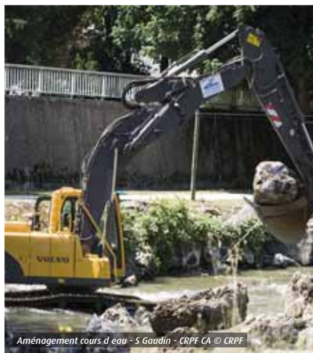
Aménagement cours d'eau

L'item s'applique pour une surface soustraite au champ d'expansion des crues supérieure à 200 m 2 et inférieure à 400 m 2 (seuil de déclaration « loi sur l'eau »).