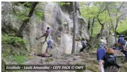
Escalade - Louis Amandier - CRPF PACA © CNPF

Cet item vise tous les types de travaux ou aménagements sur des parois rocheuses ou cavités souterraines, s'ils ne font l'objet d'aucun encadrement administratif.