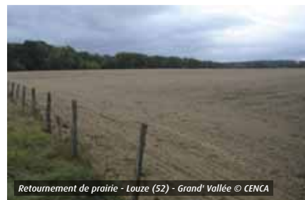
Retournement de prairie - Louze (52) - Grand' Vallée

Prairies (ou pâturages) permanents, à savoir notamment :