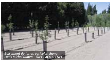
Boisement de terres agricoles chene Louis-Michel Duhen - CRPF PACA © CNPF