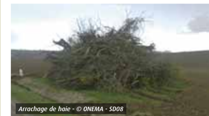
Arrachage de haie

L'arrachage de haie doit être interprété comme le fait de détruire définitivement une haie.