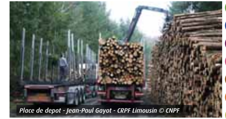
Place de dépôt

Cet item s'applique aussi bien en forêt privée qu'en forêt publique.