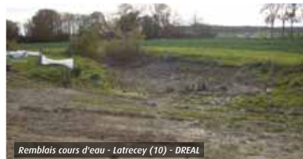
Remblais cours d'eau - Latrency (10)

Pour une zone asséchée ou mise en eau supérieure à 100 m 2 et inférieure 1 000 m 2 (seuil de déclaration « loi sur l'eau ») pour la partie de la réalisation prévue à l'intérieur d'un site Natura 2000.