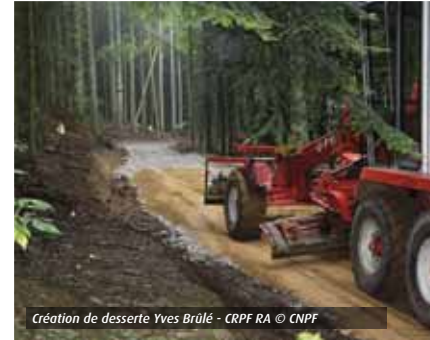
Création de desserte Yves Brûlé - CRPF RA © CNPF

permettant le passage de camions grumiers